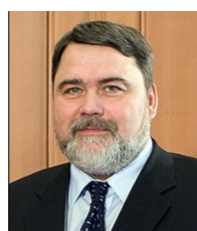
Артемьев Игорь Юрьевич, руководитель Федеральной антимонопольной службы