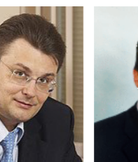
Федоров Евгений Алексеевич, председатель Комитета Государственной Думы ФС РФ по экономической политике и предпринимательству