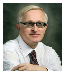
Шохин Александр Николаевич, президент РСПП