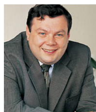
Фридман Михаил Маратович, член Бюро Правления РСПП, Председатель Комитета РСПП по собственности и защите конкуренции, Председатель Наблюдательного совета Консорциума «Альфа-Групп»